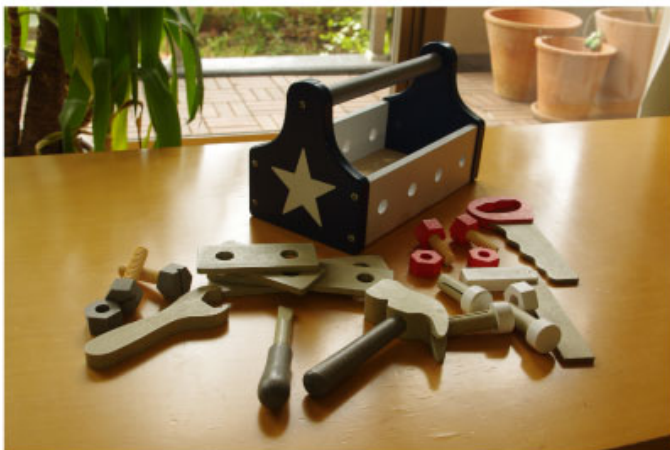
写真1枚でイメージが全然違いますね。