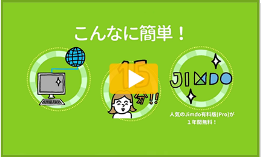
はじめてWEB サービス紹介