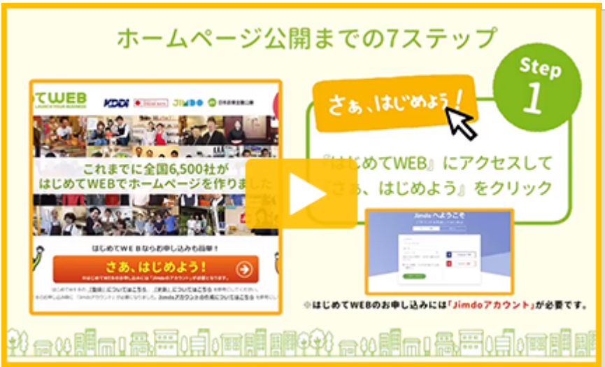
ホームページ公開の7ステップ