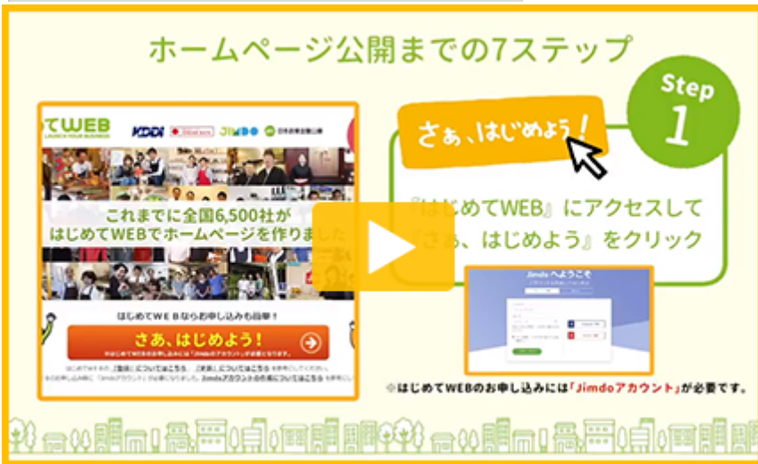
ホームページ公開の7ステップ