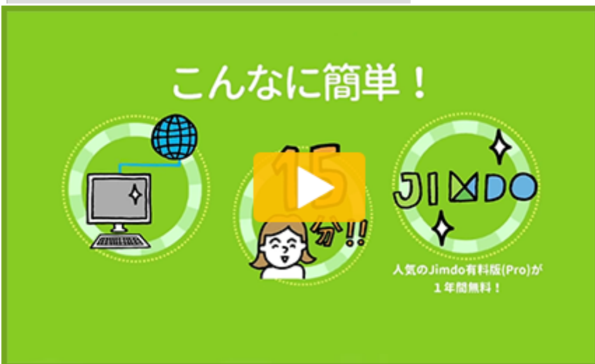
はじめてWEB サービス紹介