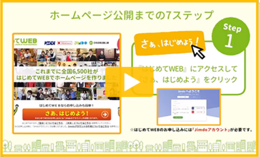
ホームページ公開の7ステップ