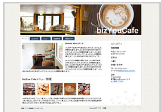
ナチュラルな雰囲気