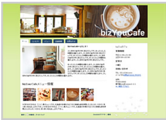
エコロジーな雰囲気