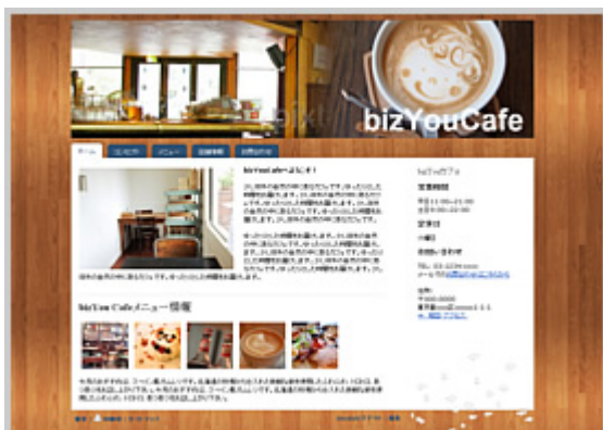
カジュアルな雰囲気

背景の変更を行う前に、どのようなテイストの背景を設定するかを検討しましょう。背景一つで、これだけ雰囲気が変わります。