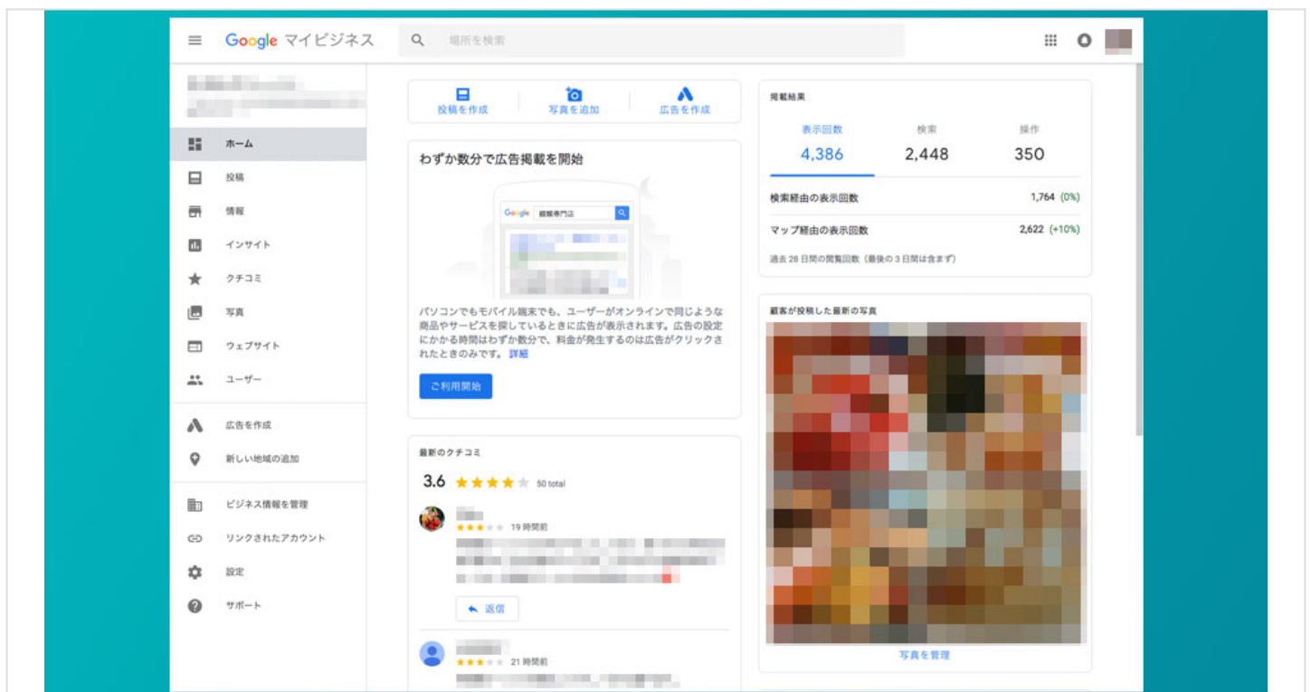
パソコン版のGoogle マイビジネスの管理画面(ホーム)